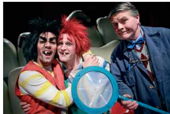
FOTO FRA PRØVENE Vegard Eggen PROGRAM May Selmer / Geir Schönberg ANSVARLIG UTGIVER Otto Homlung

INSPISIANT Line Åmli SUFFLØR Ann Eli Aasgård REKVISITØR Turid Bjørnsen TEKNISK KOORDINATOR Trond Skaug MUSIKALSK RÅDGIVER Ivar Gafseth